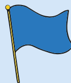
un drapeau a flag