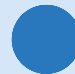
un cercle a circle