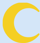
un croissant a crescent