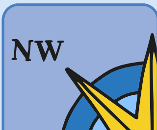
le nord-ouest the north-west