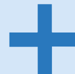
une croix a cross