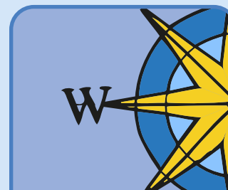
l'ouest the west