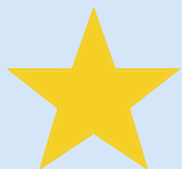
une étoile a star